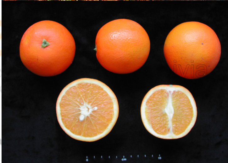
EVOLUCION LA MADUREZ DEL FRUTO